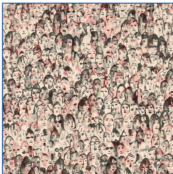
Figura 7 - O encontro de diferentes tradições culturais e diversas etnias são a chave para compreender as identidades culturais

O desenvolvimento da internet e a facilidade de deslocamento também tem uma parcela de culpa no aumento de contato com outros países e novas culturas que vêm a influenciarem na construção de nossa identidade nacional.