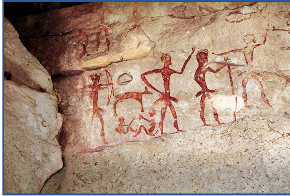
Figura 2 - Todas as culturas — presentes, do passado ou extintas — são de interesse para os estudos da Antropologia

#PraCegoVer Na figura, temos a fotografia de uma pintura em parede. Trata-se de uma cena de caça, contando com o esboço de quatro caçadores, estando um portando arco e flecha. Há, também, a imagem de um animal e duas pessoas sentadas. A pintura é em vermelho.