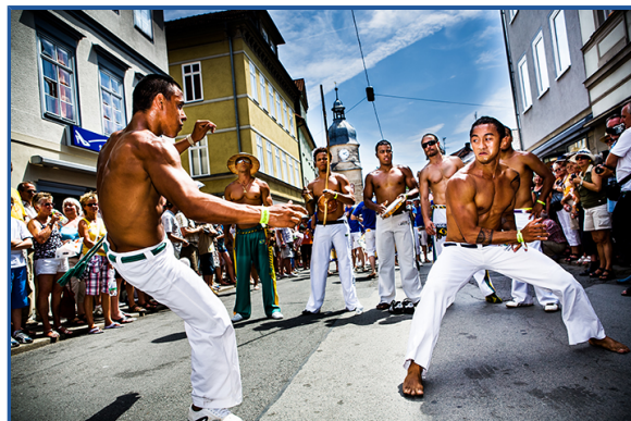
Figura 4 - A capoeira é se encaixa na ordem da cultura imaterial

A cultura imaterial , por outro lado, abarca os objetos intangíveis, os quais não possuem substância material, mas que possuem grande importância simbólica, como as danças, as músicas, os festejos e o folclore de uma região.