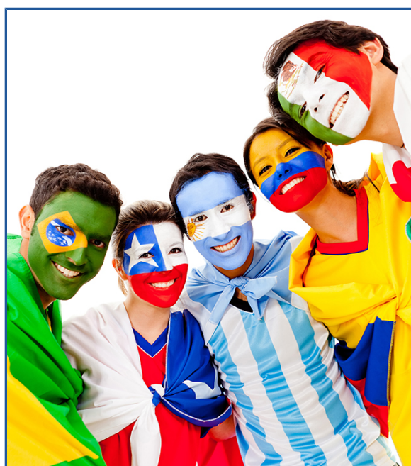
Figura 5 - No princípio da alteridade, nossa subjetividade só existe diante do contraste de uma cultura com a outra

A identidade e as diferenças existem por conta das relações sociais. Uma identidade cultural é o conjunto de características de um povo, fruto da interação entre os membros da sociedade e de sua forma de interagir com o mundo. Ela se constrói a partir do princípio da alteridade, em uma série de processos de diferenciação que definem e separam o “nós” e o “eles”. Nesse sentido, a identidade cultural se constitui das tradições, da cultura, da religião, da música, da culinária, do modo de vestir e de falar, entre outros elementos que representam os hábitos de uma nação.