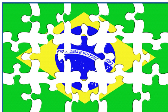
Figura 6 - A identidade nacional é fruto de vários processos históricos, culturais e políticos

O Movimento Modernista que foi impulsionado pela Semana de Arte Moderna, que aconteceu em 1922, buscaram nas raízes da sociedade inspiração para renovar e transformar os contextos artístico e cultural. O objetivo, então, era criar uma arte essencialmente brasileira, livre da reprodução dos padrões europeus (ORTIZ, 1994). No entanto, é importante termos em mente que o processo de construção de uma identidade nacional começa à partir do estabelecimento dos primeiros colonos. No seu encontro com os nativos e no acúmulo de interações entre a metrópole, os colonos e os nativos. Ou seja, a construção de uma identidade nacional não se dá apenas pelos processos culturais, mas, também, a partir de processos políticos.