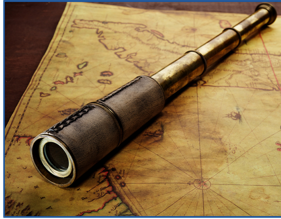
Figura 1 - No início, a Antropologia era feita à partir dos relatos de viajantes, exploradores e missionários

#PraCegoVer Na figura, temos a fotografia de um mapa antigo sobre uma mesa, com uma luneta por cima. Este traz detalhes em couro marrom.